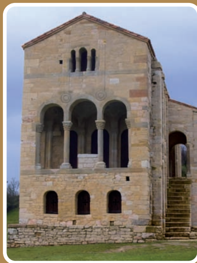
Santa María de Naranco

ENTREGA DE LOS PREMIOS LABORAL 2000 - BANESTO A LA CALIDAD Y EXCELENCIA PROFESIONAL Y EMPRESARIAL EN MATERIA SOCIO-LABORAL, DERECHO DE TRABAJO Y SEGURIDAD SOCIAL, EN SU DECIMA EDICIÓN Y CORRESPONDIENTES AL AÑO 2011