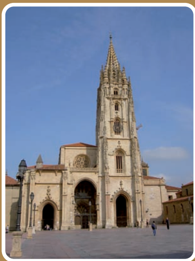
Catedral de Oviedo